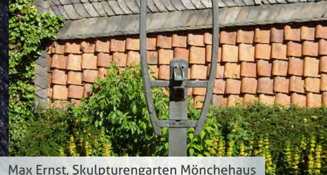
Max Ernst, Skulpturengarten Mönchehaus