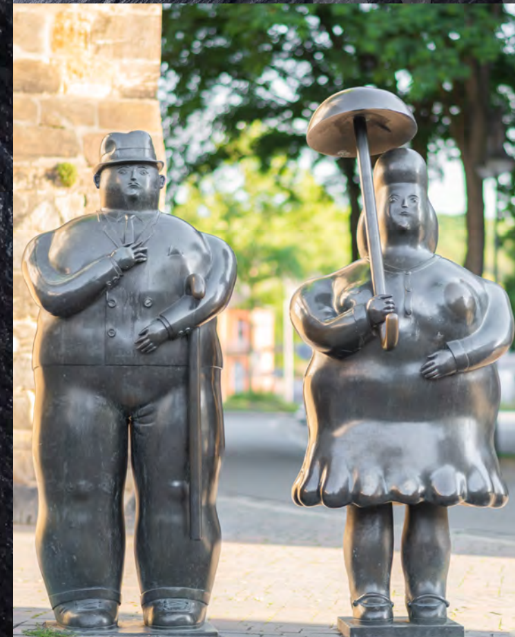
Fernando Botero, Rosenthal