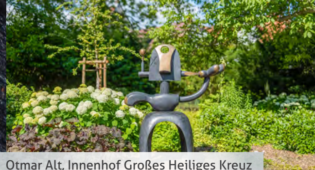
Otmar Alt, Innenhof Großes Heiliges Kreuz