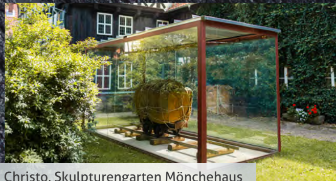
Christo, Skulpturengarten Mönchehaus

(Reduzierter Eintritt für Teilnehmer der Stadtführung „Art Walk - Kunstspaziergang durch Goslar“)