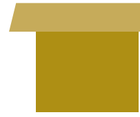
Dachüberstand vorn Tiefe Dachüberstand hinten